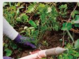
カーボンオフセット