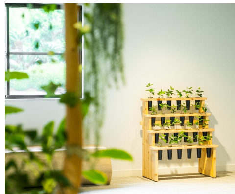
ラダー型MODRINAE (24本) 770mm x 900mm x 400mm 440,000円(税込)