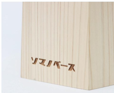
木鉢型MODRINAE (1本) レーザー加工入り 14,300円(税込)