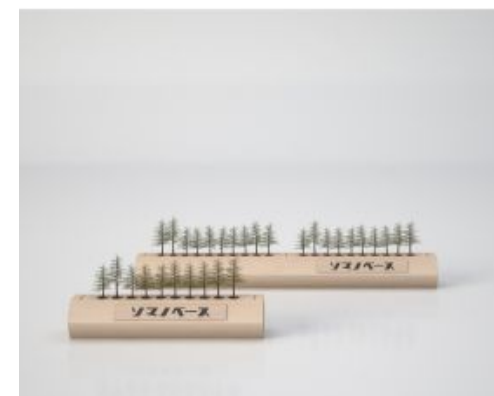
丸太型MODRINAE (10本) 1050mm x 205mm x 230mm 330,000円(税込)