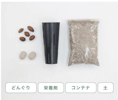
どんぐり 栄養剤 コンテナ 土

MODRINAEで苗木を育てて植樹のために送り返した後に継続して新しい苗木を育てる場合は、リスタートセットのみの購入でよいので初期の購入代金より安く開始することができます。