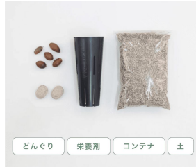
どんぐり 栄養剤 コンテナ 土