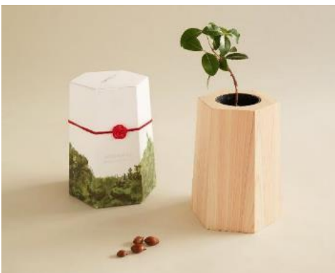
木鉢型MODRINAE (1本) 12,100円(税込)